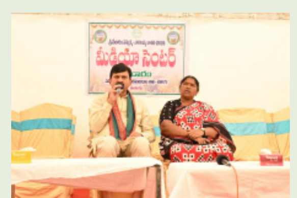
రామప్ప నుంచి లక్ష్మవరం మీదుగా జంపన్న వాగుకు లింక్ చేసేలా చర్యలు చేపడుతున్నామని అన్నారు.బాసర నుంచి భద్రాచలం వరకు 2500 కోట్లతో టెంపుల్ సర్క్యూట్ అభివృద్ధి చేసేందుకు ప్రజా ప్రభుత్వం చర్యలు చేపట్టిందని, టెంపుల్ సర్కిల్ మేడారం ను కూడా భాగస్వామ్యం చేస్తామని అన్నారు. గోదావరి పరిపాలక ప్రాంతంలో ఉన్న దేవాలయాలను సకల వసతులతో అభివృద్ధి చేసేందుకు చర్యలు తీసుకుంటుందని అన్నారు.

మంత్రి సీతక్క మాట్లాడుతూ: సమకూ సారలమ్మ జాతరకు పక్కంబి ఏర్పాటు చేశామని అన్నారు. 45 రోజుల నుంచి మేడారం కు భక్తులు భారీ ఎత్తున వస్తున్నారని అన్నారు. ప్రభుత్వం పట్టుదలతో రికార్డు సమయంలో సమకూ సారలమ్మ ఆశీర్వాదంతో జాతర శాశ్వత వసులు పూర్తి చేశామని అన్నారు. 2010 నుంచి సీఎం రేవంత్ రెడ్డి సమకూ సారలమ్మ జాతరకు వస్తున్నారని, ముఖ్యమంత్రి కాగానే ఇక్కడ మౌలిక వసతుల కల్పనకు ప్రత్యేక చర్యలు తీసుకున్నారని తెలిపారు. రోడ్డు విస్తరణ 4 లైన్లు చేయడం వల్ల భక్తులకు చాలా ఇబ్బందులు తగ్గాయని అన్నారు. మంచి నీటి వ్యవస్థ, టాయిలెట్స్ శాశ్వతంగా కల్పించేలా చర్యలు చేపట్టమని అన్నారు. సమకూ సారలమ్మ జాతర ప్రదేశంలో పచ్చదనం ఉండేలా చెట్ల పెంపకం చర్యలు తీసుకుంటామని అన్నారు. ఈ కార్యక్రమంలో పాత్రికేయులు, సమాచార శాఖ సంయుక్త సంచాలకులు, డి.ఎస్. జగన్ , తదితరులు పాల్గొన్నారు.