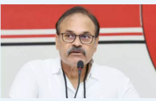
కూటమిపరంగా రాజకీయ అంశాలపై కీలక చర్యలు జరుపుతారని తెలుస్తోంది.