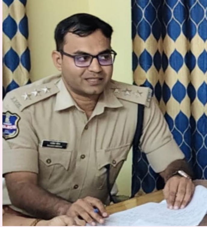
ర్యాలీలు, రాస్తాకోళ్లు, ధర్నాలు నిర్వహిస్తే కఠిన చర్యలు తీసుకుంటామని ఆయన హెచ్చరించారు. ఎన్నికల ప్రశాంతంగా, న్యాయంగా జరిగేలా ప్రతి ఒక్కరూ సహకరించాలని జిల్లా పోలీస్ శాఖ విజ్ఞప్తి చేసింది.